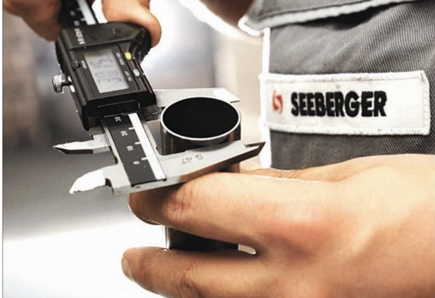
Die systematische Qualitätskontrolle steht in allen Fertigungsbereichen im Mittelpunkt.